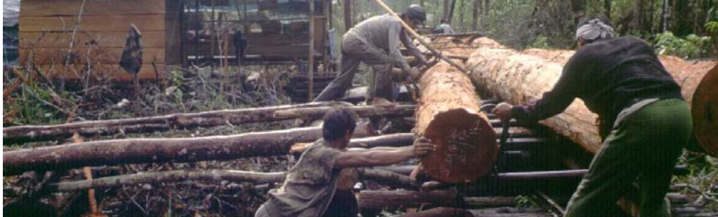
P. V. Gardingen/FRP

aceptan madera ilegal procedente de los países productores, los esfuerzos para apoyar reformas en los sectores madereros de estas regiones se ven realmente amenazados.