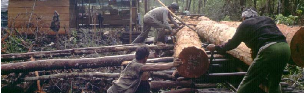
P. v. Gardinger/FRP

leyes y reglamentaciones que se aplican a la gestión de los bosques y a la producción de madera. La definición de madera producida legalmente deberá derivarse de esa normativa y regular las consecuencias más importantes que acarree su incumplimiento.