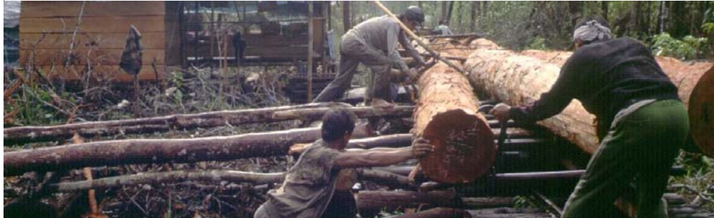
P. V. Gardingen/FRP